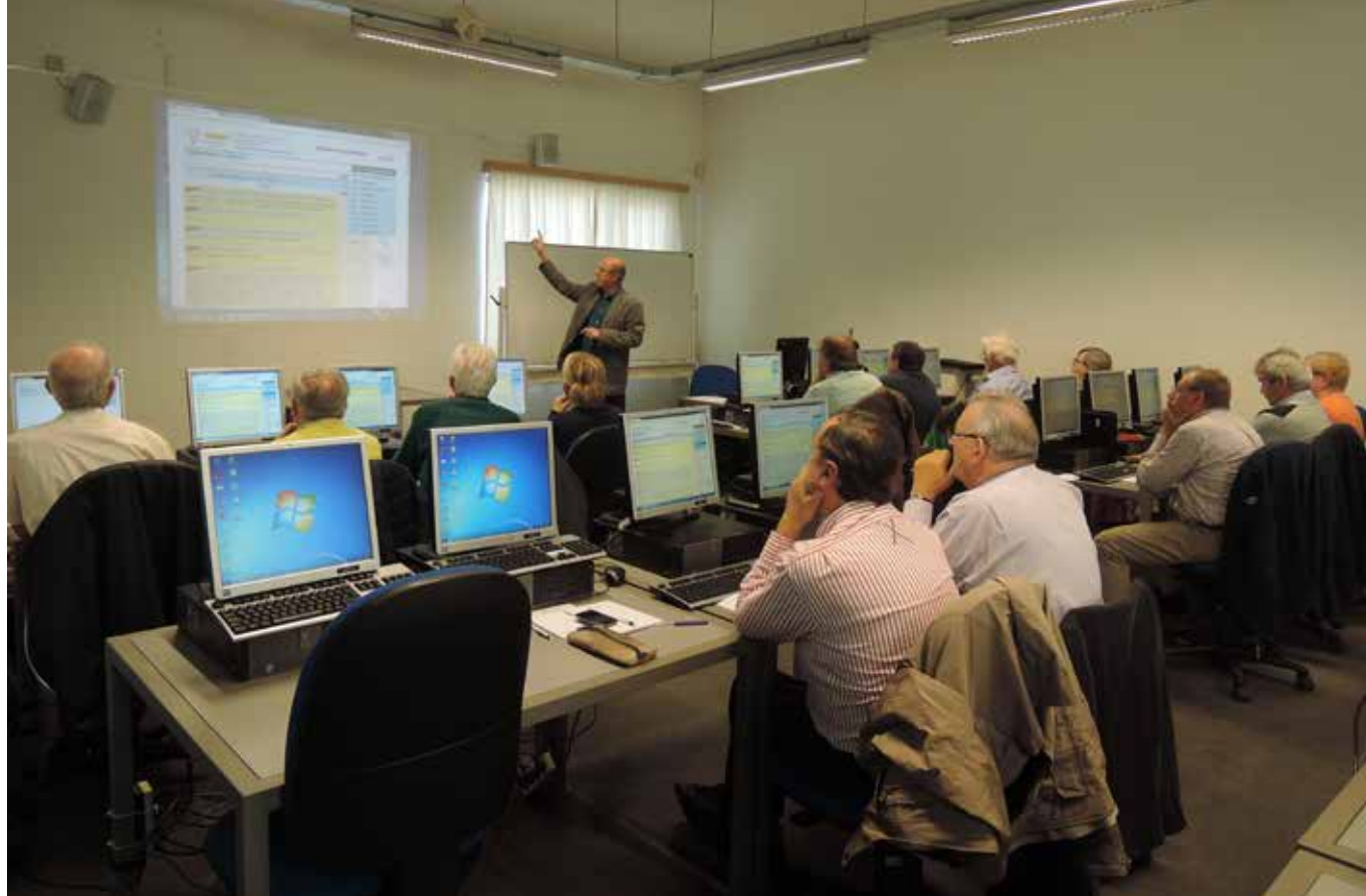
Opleidings sessie van 3 oktober 2015 in de Permekebibliotheek te Antwerpen voor de catalografen van de nieuwe bibliotheekcatalogus.

verschillende afdelingen en documentatiecentra van Familiekunde Vlaanderen.