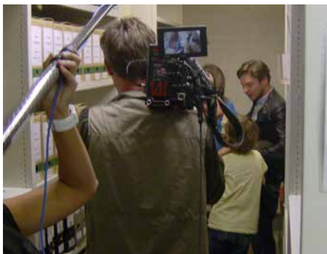
De bibliotheek van het Documentatie- en Studiecetrum voor Familiegesciedenis te Merksem als decor voor het Ketnetprogramma 'Ben ik familie van?'.

FV-regio's Brugge, Dendermonde, Dilbeek, Leuven, Mandel-Leie, Westkust, het Vlaams Centrum voor Genealogie en Heraldiek (Handzame), het West-Vlaams Documentatiecentrum voor Familiegesciedenis (Oostende) en het Documentatie- en Studiecetrum voor Familiegesciedenis (Merksem) sprongen meteen mee op de kar. Ook FV-regio Gent zal binnenkort haar bibliotheek in Bidoc catalogiseren. De (overkoepelende) Bidoc-catalogus omvat nu al bijna 130.000 artikels en meer dan 47.000 werken en wordt bijna dagdagelijks aangevuld.