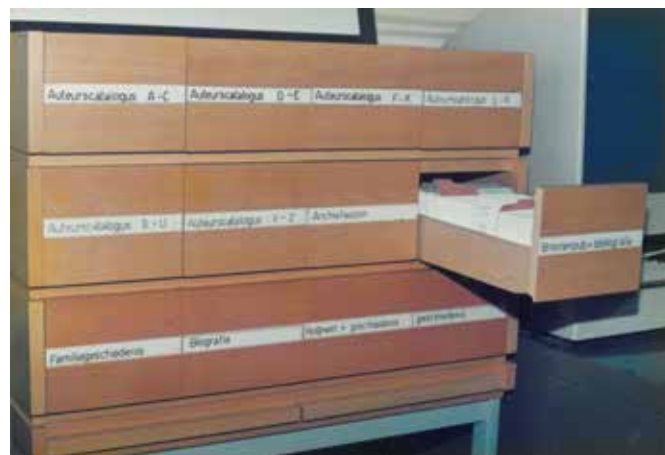
Archiefbeeld van het fichesysteem in het Documentatie- en Studiecetrum voor Familiegesciedenis.